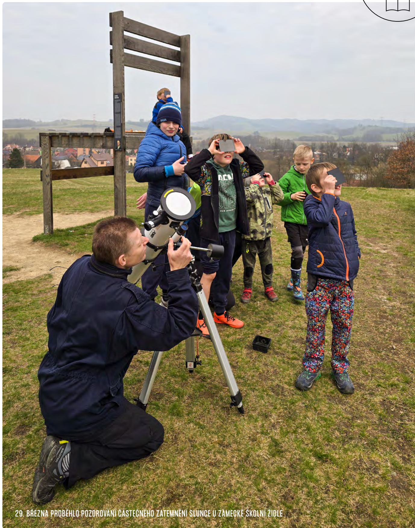
29. BŘEZNA PROBĚHLO POZOROVÁNÍ ČÁSTEČNÉHO ZATEMNĚNÍ SLUNCE U ZÁMECKÉ SKOLNÍ ŽIDLE