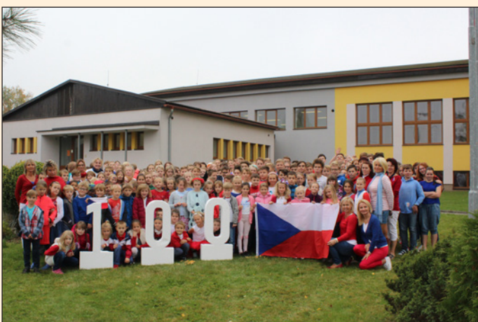
ZŠ Hodslavice - barva trikolóry