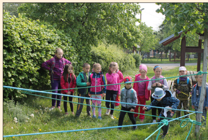
Royal Rangers - zdolání překážky