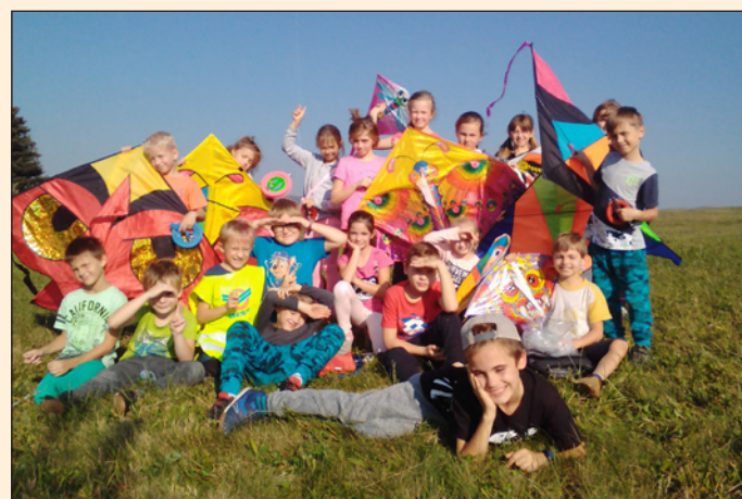
ZŠ Hodslavice - drakiáda ve školní družině