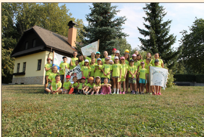
Royal Rangers - Robisoni