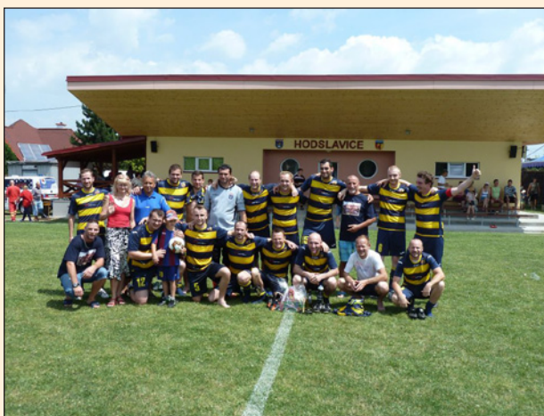
Den obce 2017, v pozadí rekonstruované šatny

jsme získali dotaci z Ministerstva zemědělství (1,75mil.Kč). Dle zpracované projektové dokumentace probíhá od října rekonstrukce břehů, přepadu a stavidla vodní nádrže. Na odbahnění odkalovací nádrže jsme dotaci bohužel nedostali. Práce by měly být ukončeny v termínu do konce dubna.