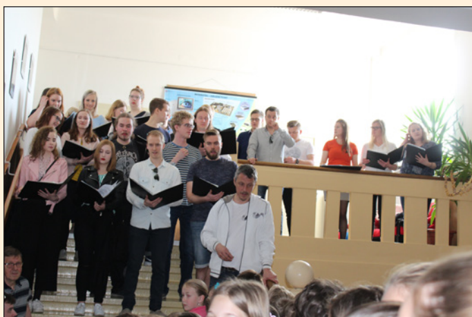
ZŠ Hodslavice - návštěva z Finska