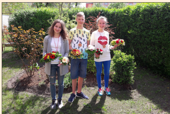
ZŠ Hodslavice - soutěž ve floristice