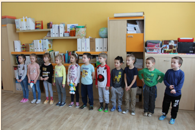
ZŠ Hodslavice - projekt „Škola volá“