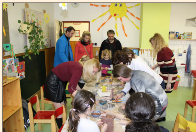
ZŠ Hodslavice - velikonoční tvoření