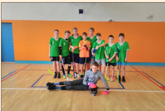
ZŠ Hodslavice - street hockey