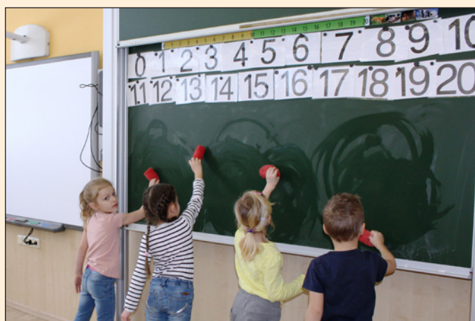
ZŠ Hodslavice - projekt „Škola volá“