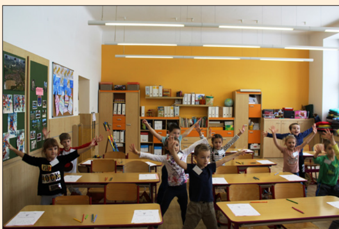
ZŠ Hodslavice - projekt „Škola volá“