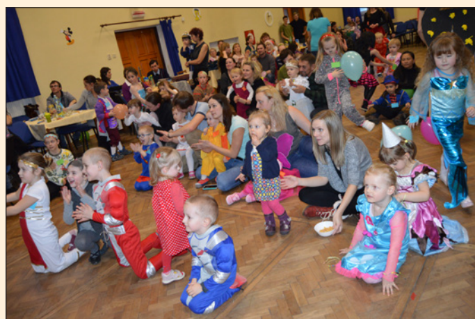
Maškarní ples SHM Hodslavice