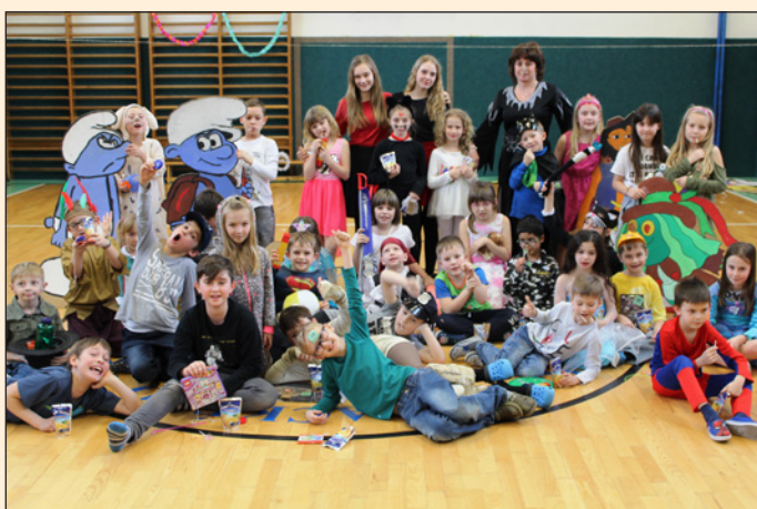
ZŠ Hodslavice - maškarní ples školní družiny