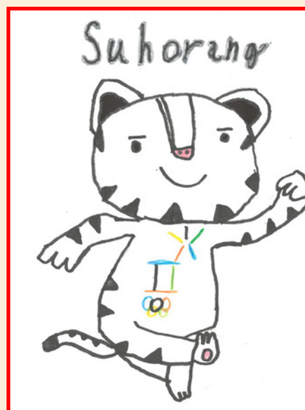
Ondřej Novotný, 4.třída ZŠ Hodslavice

Přejeme hodně zdraví, spokojenost a rodinnou pohodu.