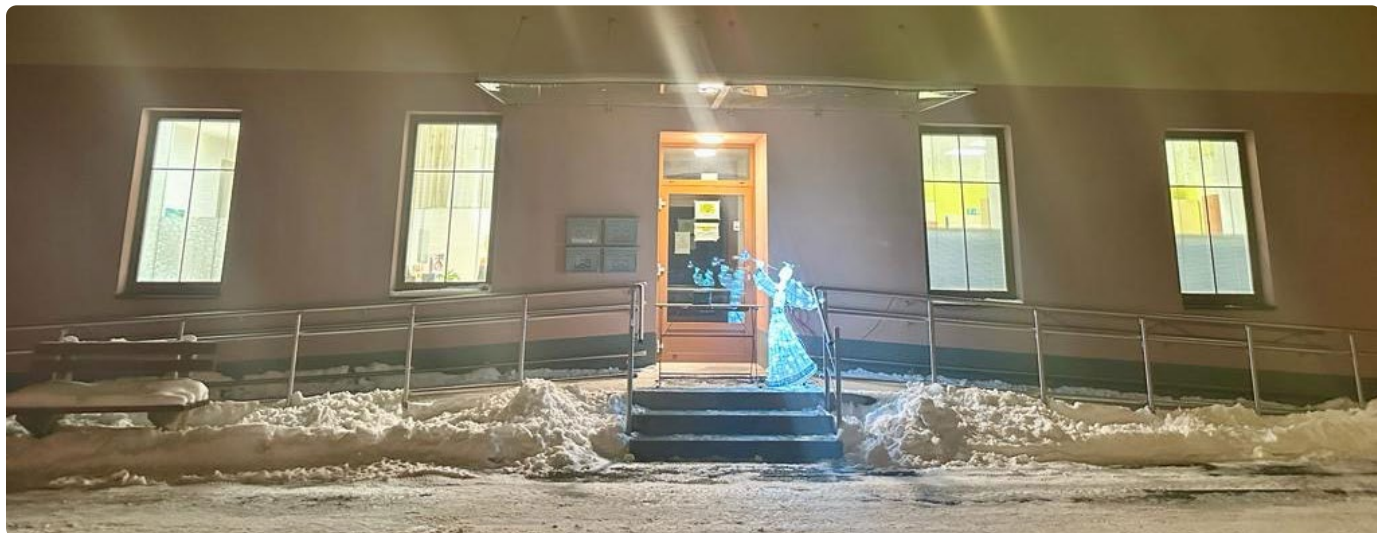
ANDĚLEK BĚHEM ADVENTU V HODSLAVSKÝCH ULIČKÁCH ROZZÁŘIL TAKÉ PŘEDPROSTOR OBECNÍHO DOMU