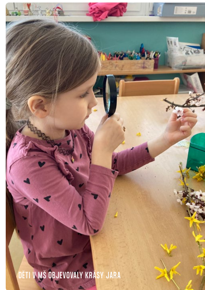
DĚTI V MŠ OBJEVOVALY KRÁSY JARA

K pohádkám se také váže zpěv a hudba a to bylo našim dalším zajímavým tématem, které nás provázelo celý týden. Ve třídě Sluníček se děti seznámily s tradičními i netradičními nástroji.