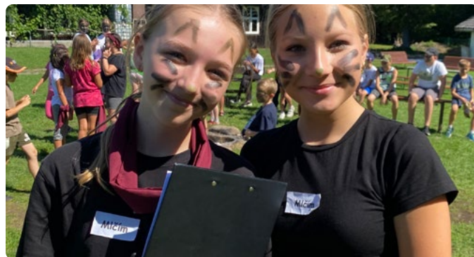
KLUB DŮCHODCŮ NA PUSTEVNÁCH