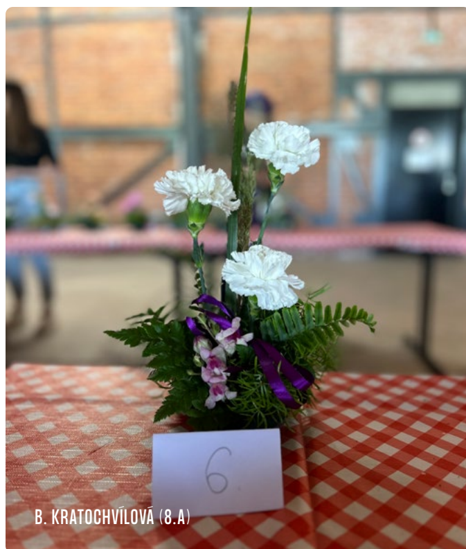
B. KRATOCHVÍLOVÁ (8.A)

Hodslavský zpravodaj – informační měsíčník pro občany Hodslavic. Roznos (11x ročně). Náklad 550 výtisků. Adresa redakce: Obecní úřad Hodslavice, č. p. 211, IČO 00297917, zpravodaj@hodslavice.cz, 556 750 010. Příspěvky neprocházejí jazykovou úpravou. Ev. č. MK ČR E11145. Hodslavice, č. 10/23, vydáno 12. 10. Grafická úprava: Panfolk