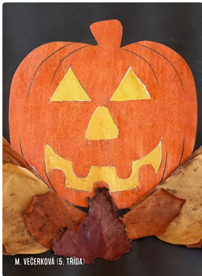
M. VEČERKOVÁ (5. TŘÍDA)

Hodslavský zpravodaj – informační měsíčník pro občany Hodslavic. Roznos (11x ročně). Náklad 550 výtisků. Adresa redakce: Obecní úřad Hodslavice, č. p. 211, IČO 00297917, zpravodaj@hodslavice.cz, 556 750 010. Příspěvky neprocházejí jazykovou úpravou. Ev. č. MK ČR E 11145. Hodslavice, č. 11/23, vydáno 13. 11. Grafická úprava: Panfolk