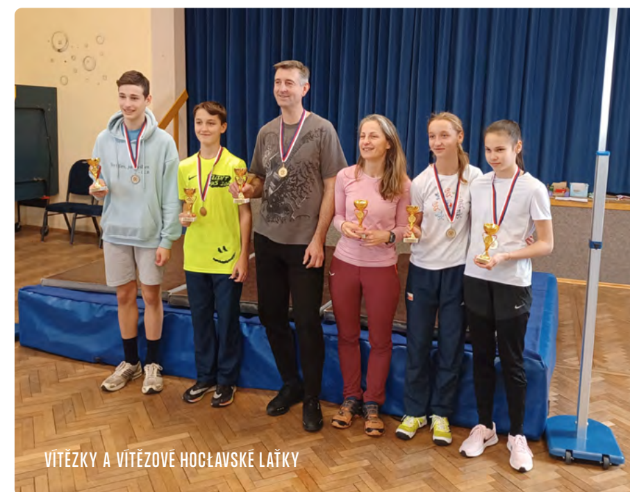
VÍTEŽKY A VÍTEŽOVÉ HOCĽAVSKÉ LAŤKY