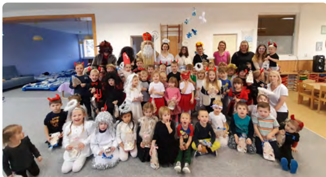
MIKULÁŠ S KOLEGY NAVŠTÍVIL MATEŘSKOU ŠKOLU