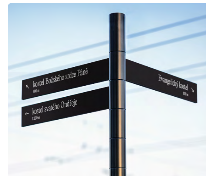
TOTEM ORIENTAČNÍHO SYSTÉMU