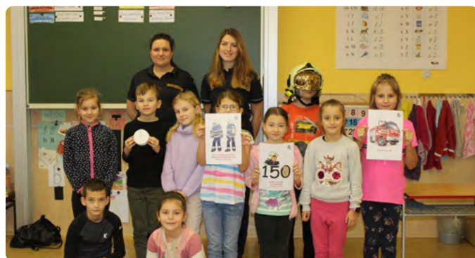
DĪKY HASĪKU DĚTI VĚDĪ, JAK SE CHOVAT V KRIZOVÝCH SITUACÍCH