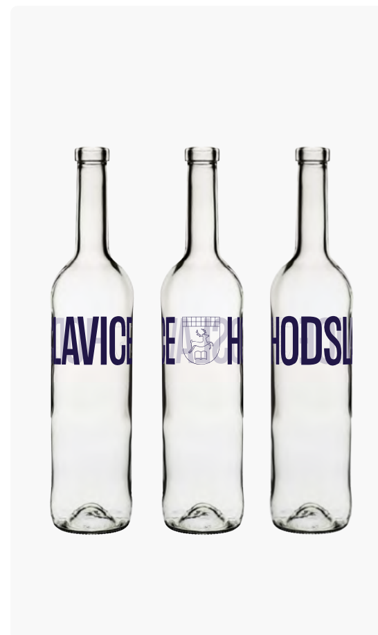
HODSLAVSKÁ SEDMIČKA: DŮSTOJNÝ OBAL NA OVOCE

Nová grafika zpravodaje je jako zapořítá plachta lodí čekající na svěží vítr kvalitního obsahu. Tímto vyzýváme občany, kteří rádi píší, aby se zapojili do tvorby zpravodaje. Výběr témat je zcela na vás. Ať už se rozhodnete přispět jedním článkem nebo založíte vlastní pravidelnou rubriku, své texty zasílejte na mailovou adresu zpravodaj@hodslavice.cz a podílejte se tak na pestřejším zpravodajství z naší obce. Spolu s výzvou k psaní otevíráme diskuzi nad možností změnit název zpravodaje. Máte tip na nový, lépe vystihující Hodslavice? Pošlete nám jej!