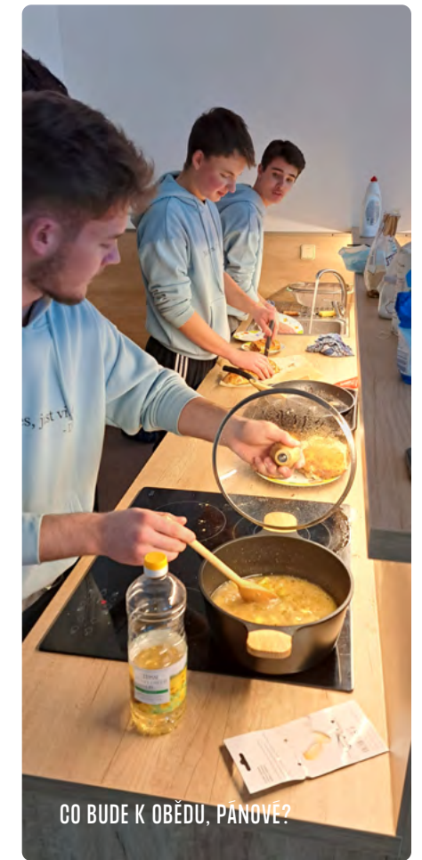
CO BUDE K OBĚDU, PÁNOVÉ?

Co vy na to? Pomůžete nám, aby i hodslavská tradice se našim žákům předala a přežila do dalších generací.