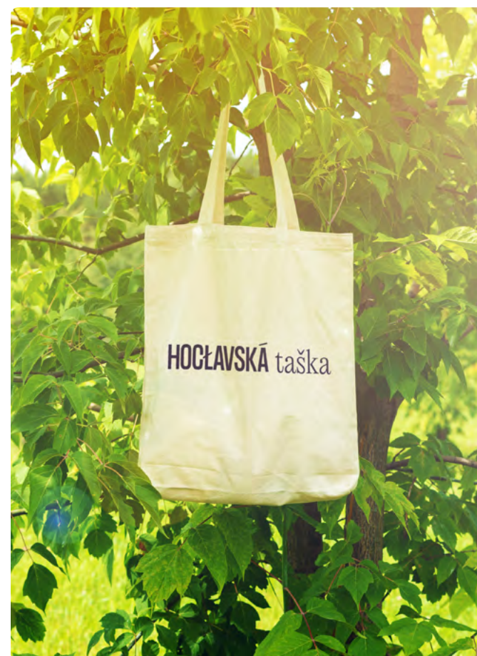
HODSLAVSKÝ TOTE BAG Z BIO BAVLNY