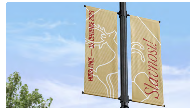
DVOJICE OUTBANNERŮ S UKÁZKOU OBEČNÍ GRAFIKY