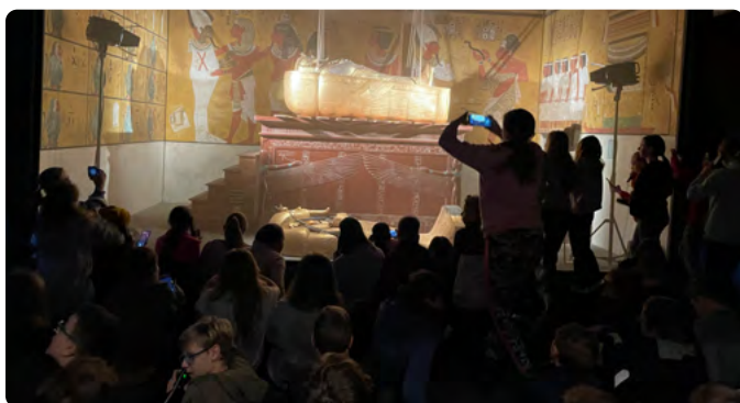
ŠESTĀCI A SEMĀCI U MODELU HROBKY TUTANCHĀMONA