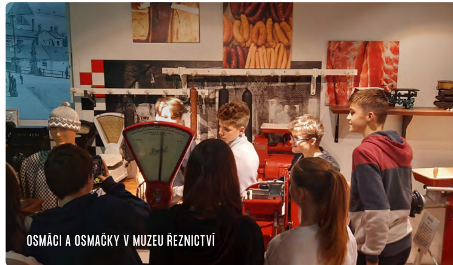
OSMÁCI A OSMÁČKY V MUZEU ŘEZNICTVÍ

Na exkurzi do Brna, za poznáním tajemství Tutanchamonovy hrobky, vyrazili ve středu 7. prosince šestáci a sedmáci. Během prohlídky shlédli dokument, který představil