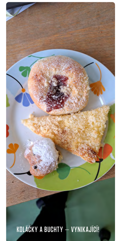
KOLÁČKY A BUCHTY – VYNIKAJÍCÍ!