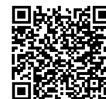
NA HODSLAVSKÉ ŠKOLE — HRA