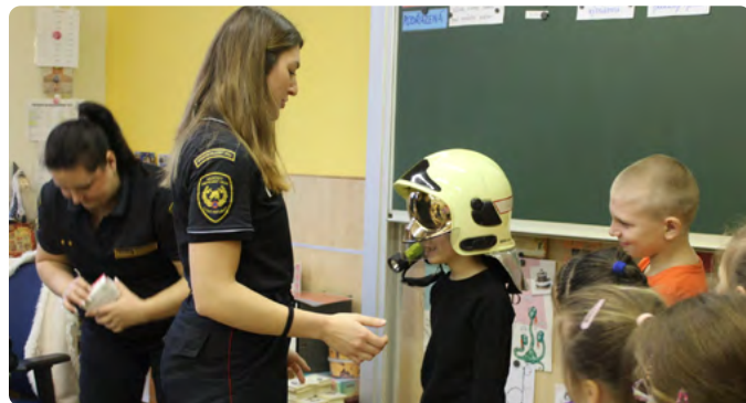
PREVENTIVNÍ PROGRAM HASÍK PRO 2. A 6. TŘÍDU