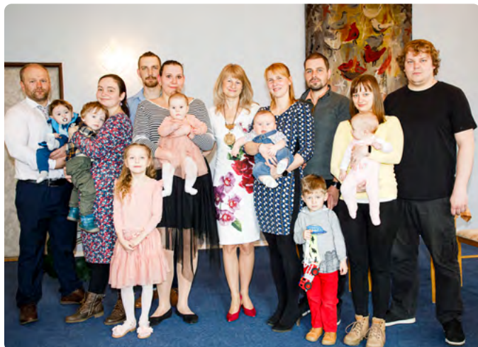
VÍTÁNÍ OBČÁNKŮ 16. 4. — 1. SKUPINA