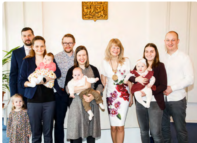
VÍTÁNÍ OBČÁNKŮ 16. 4. — 2. SKUPINA