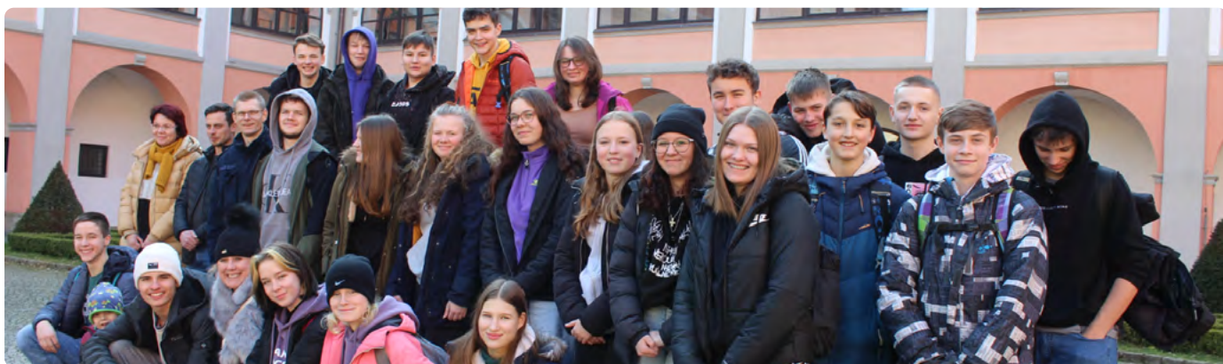
DEVĚTÁČKY A DEVĚTÁCI NA VÝSTAVĚ KORUNOVAČNÍCH KLENOTŮ VE VALAŠKÉM MEZIŘÍČÍ