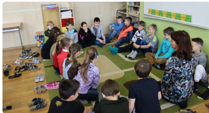
NÁVŠTĚVA BUDOUCÍCH SPOLUŽÁKŮ Z HOSTAŠOVIC