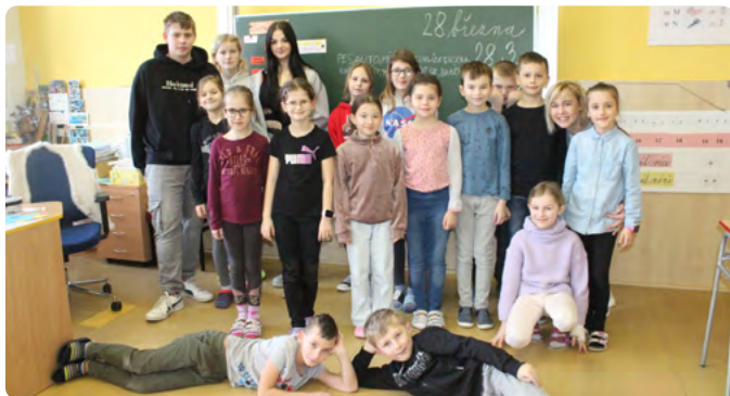
DEN NARUBY: ŽÁCI A ŽÁKYNĚ UČÍ, UČITELKY A UČITELÉ STUDUJÍ