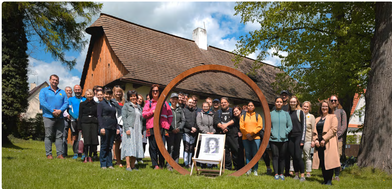
FOTO ZDE + NA TITULNÍ STRANĚ: NÁVŠTĚVA ZÁSTUPCŮ UNIVERZITY PALACKÉHO V HODSLAVICÍCH