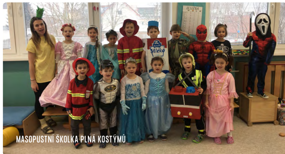
MASOPUSTNÍ ŠKOLKA PLNÁ KOSTÝMŮ

V dalším týdnu nás čekalo masopustní a karnevalové období. Dozvěděli jsme se, co je to masopust a karneval, jaké se pořádaly oslavy masopustu, jaké byly a také do teď jsou masopustní tradice, upekli jsme si masopustní koláčky a ani jsme nezapomněli