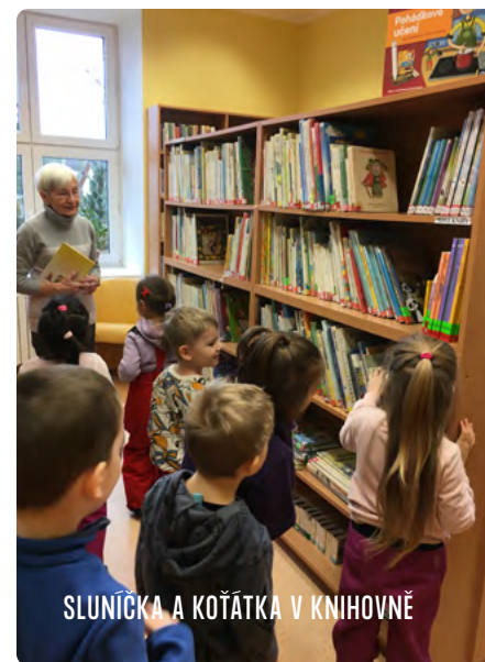
SLUNÍČKA A KOŤÁTKA V KNIHOVNĚ

Už teď se těšíme na první jarní měsíc a na krásu přírody, kterou půjdeme zkoumat a objevovat.