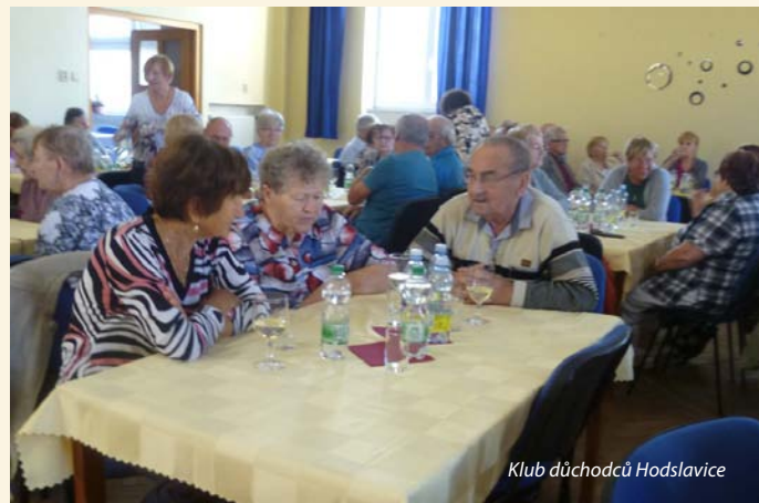
Klub důchodců Hodslavice