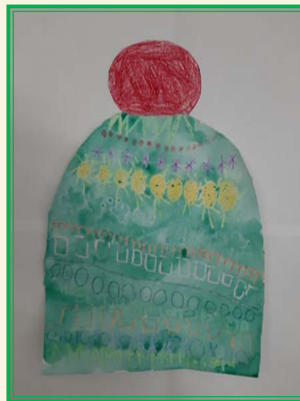
Lukáš Kudělka, 1. třída