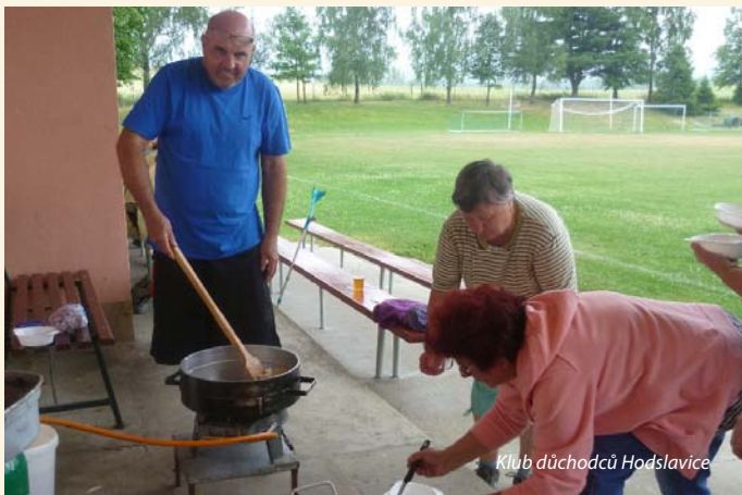
Klub důchodců Hodslavice