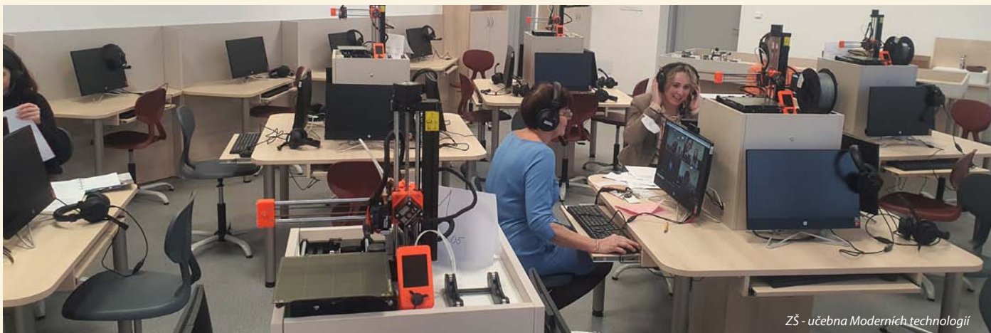
ZŠ - učebna Moderních technologií