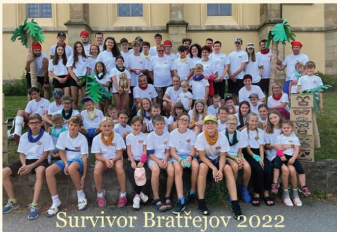
Survivor Bratřejov 2022

Milé děti těšíme se na společná setkání v kroužcích a přejeme krásné podzimní dny všem.