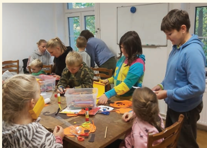
Salesiánské hnutí mládeže