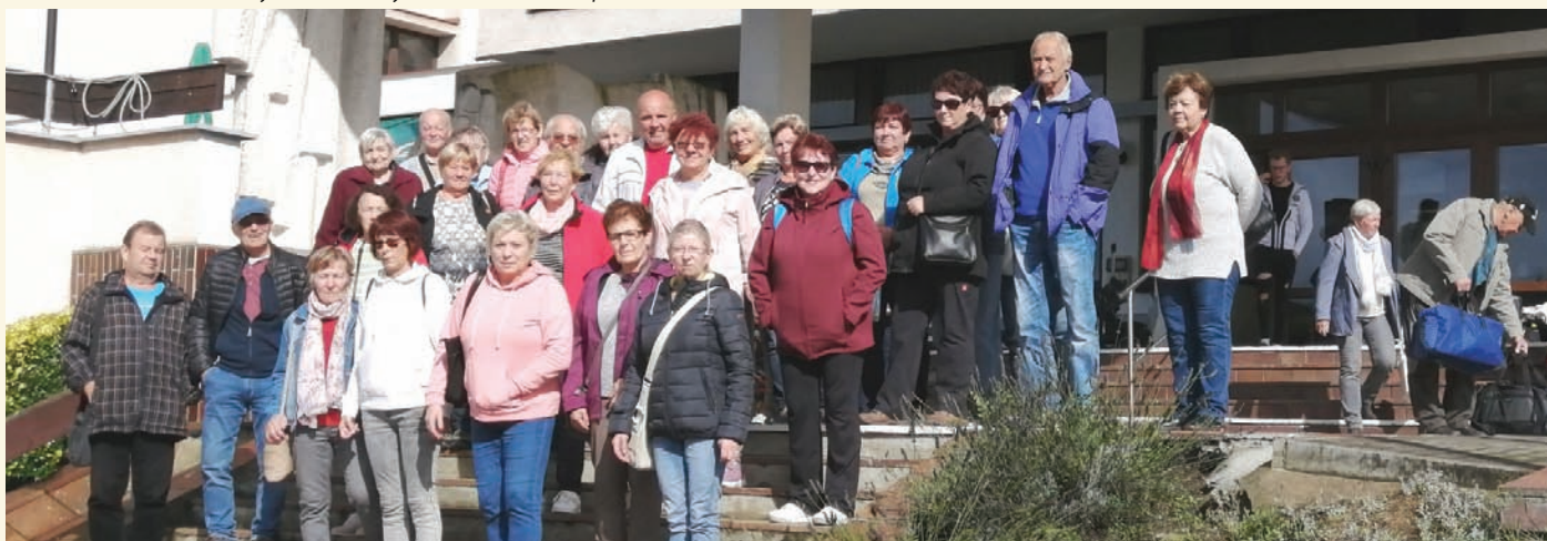
Klub důchodců - wellness pobyt v Luhačovicích