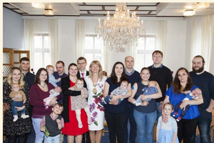
Vitání občánků 24.4.2022