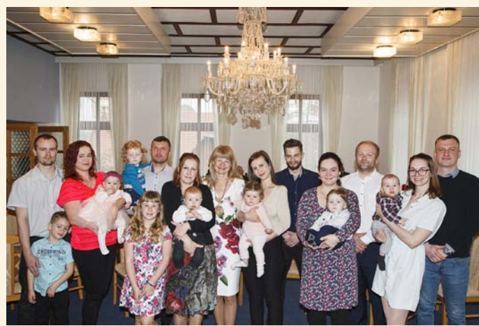
Vitání občánků 24.4.2022