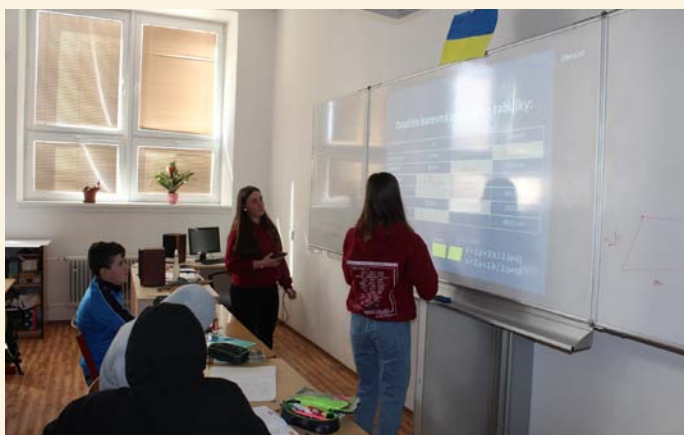
ZŠ - Den naruby