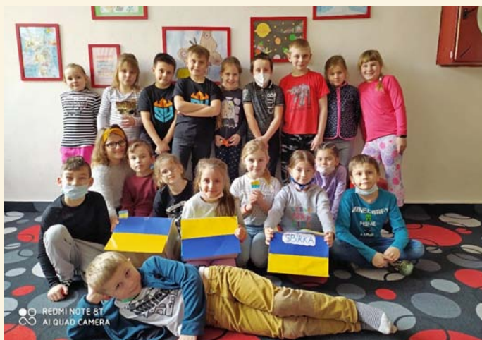
ZŠ - Děti pomáhají dětem