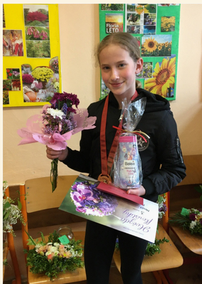
Okresní kolo ve floristice