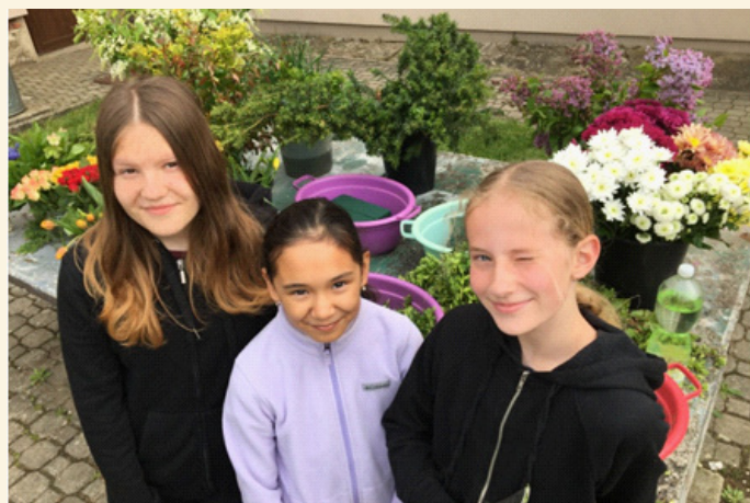
Okresní kolo ve floristice