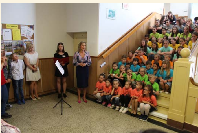
ZŠ - Den otevřených dveří