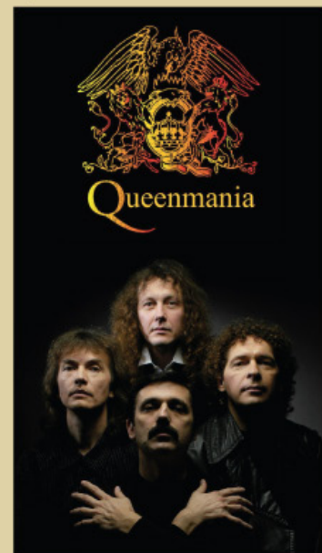
Deni a Teri 16:20