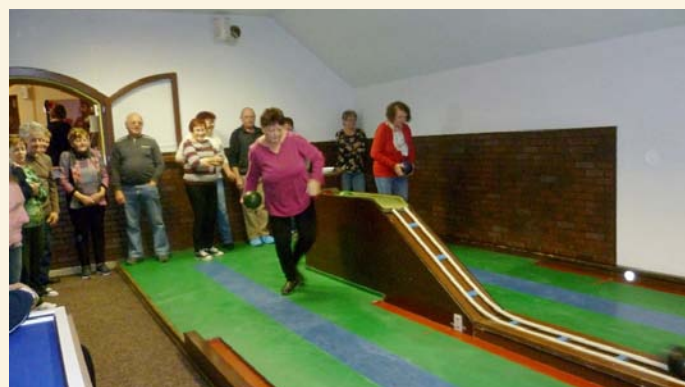
Klub důchodců - bowling