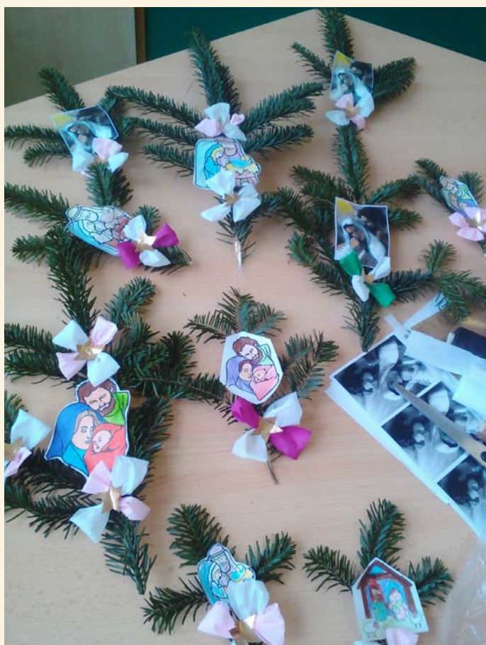
ZŠ - Štěstí, zdraví