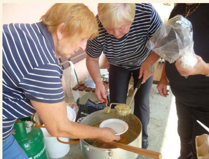
Klub důchodců - skračení