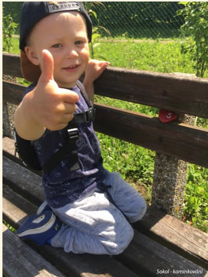
Sokol - kamínkování