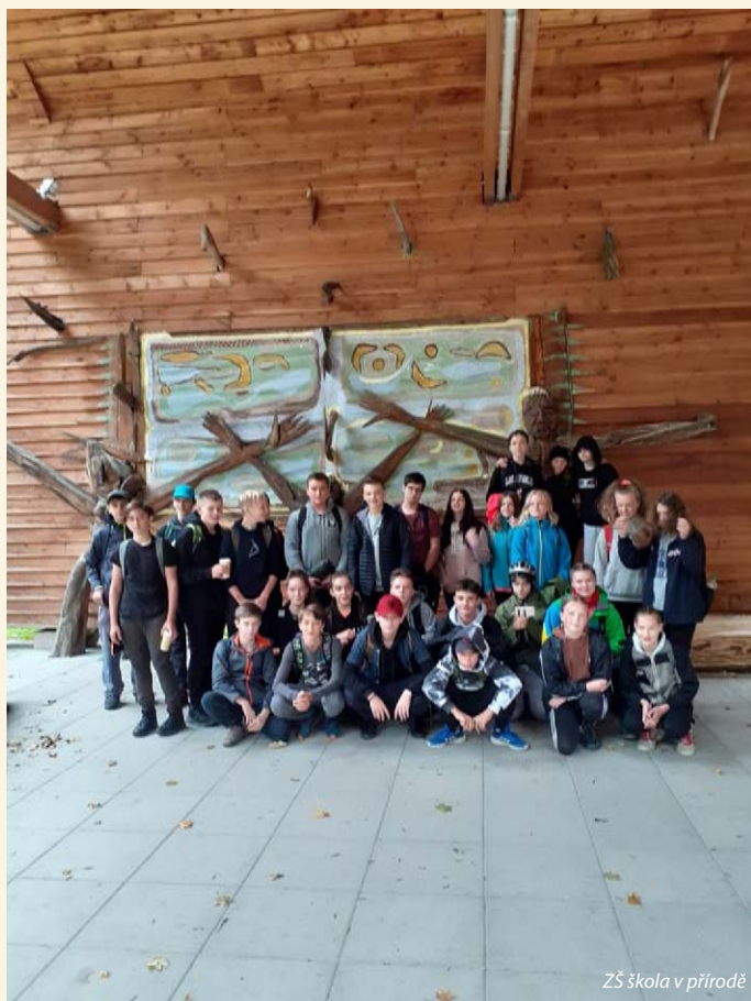
ZŠ škola v přírodě