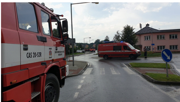
Zásah Jeseník nad Odrou

Na závěr bychom chtěli poděkovat všem členům jednotky za odvedenou práci. Poděkování patří velitelům, strojníkům a členům jednotky a sboru, vedení obecního úřadu v čele s paní starostkou a panem místostarostou, zastupitelstvu obce, pracovníkům obecního úřadu, občanům, sponzorům, kteří nám pomáhali naplnit stanovené úkoly v loňském roce.