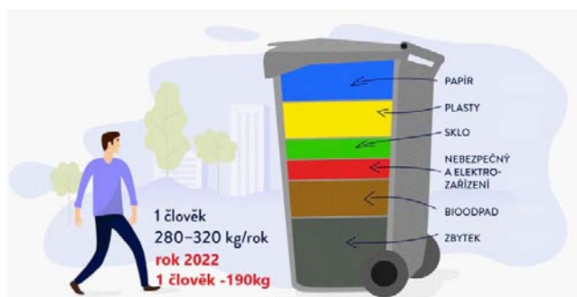
Obrázek: Skladba průměrné popelnice v Česku, zdroj: EKO-KOM.

O stavu vývoje našeho odpadového hospodářství vás budeme pravidelně informovat.