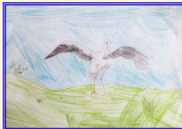
Ester Davidová, 2. tř.