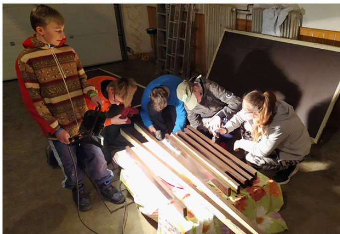
Příprava na sportovní sezónu

Ale sbor jako takový nezhálel. Pokud to jenom trochu dovozovala situace, tak se členové kolektivu mladých hasičů scházeli v hasičské zbrojnici a připravovali se na závodní sezónu, která byla bohužel také zrušena. I tak si připravili nářadí a technické prostředky pro svou činnost. Díky dotaci Moravskoslezského kraje byly mladým hasičům pořízeny zcela nové překážky, které mají certifikaci pro použití na soutěžích v požárním sportu.