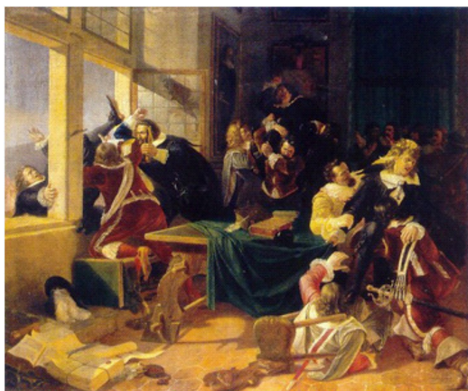
Zásah Jeseník nad Odrou

Třicetiletá válka začala pražskou defenestrací, která proběhla 23. května 1618 a z oken Pražského hradu byli vyhozeni královští místodržící. Tato defenestrace se stala demonstrativním aktem odporu českých stavů proti porušování Rudolfova majestátu (listina zaručující náboženskou svobodu, která byla vydána 9. července 1609 císařem Rudolfem II.). Hlavním představitelem českého stavovského povstání byl Jindřich Matyáš Thurn. Po vyhození královských místodržících z oken byla zvolena prozatímní vláda třiceti direktorů, která nahradila správu pěti královských místodržících a generálem stavovské armády byl zvolen Jindřich Matyáš Thurn.