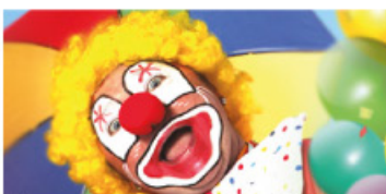
Klaun Pepino prcek od 16:10