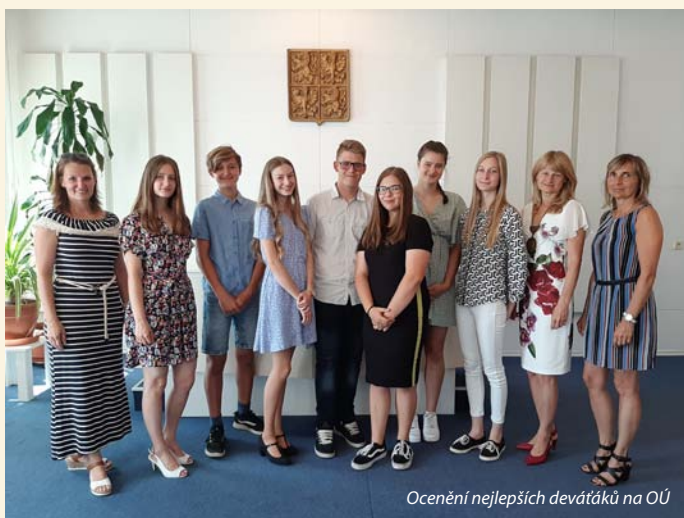
Ocenění nejlepších devěťáků na OÚ