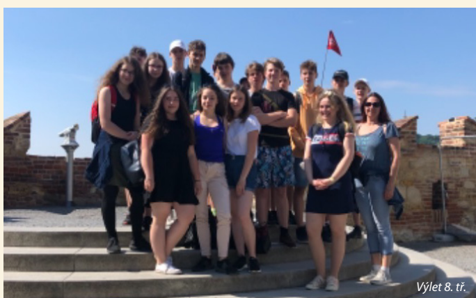
Výlet 8. tř.