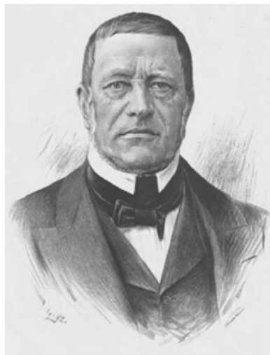
František Palacký (14.06.1798 – 26.05.1876)