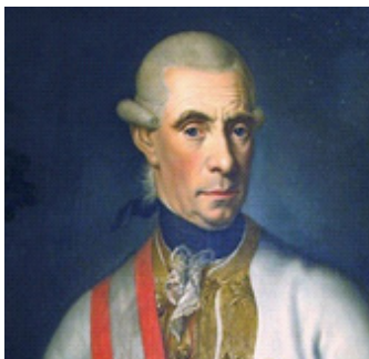
Ernst Gideon von Laudon (13.02.1717 – 14.07.1790)

Jistě jste poznali slova ze známé písně o generálu Laudonovi. Můžeme se jen domnívat, zda tato slova se vztahují i na naši obec. Ovšem co můžeme s jistotou říci je to, že generál Laudon navštívil Nový Jičín za svůj život celkem dvakrát a není tak vyloučenou, že právě do Nového Jičína mohl se svou armádou projíždět právě