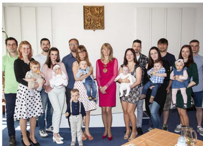
Vítání občánků 15.5.2021