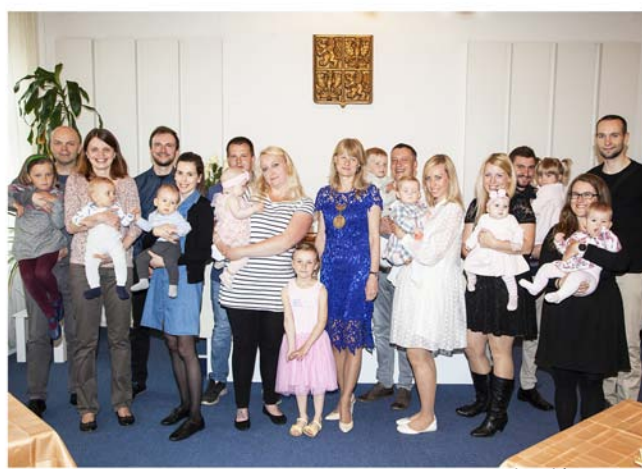
Vítání občánků 15.5.2021