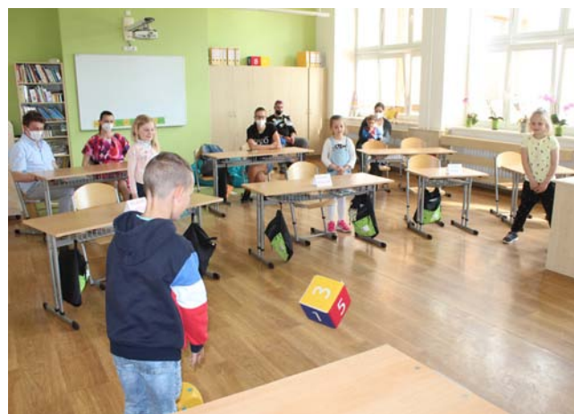
ZŠ - budoucí školáci