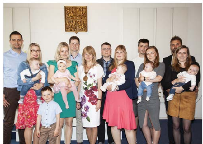
Vítání občánků 15.5.2021