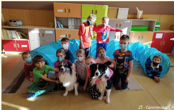
ZŠ - Canisterapie