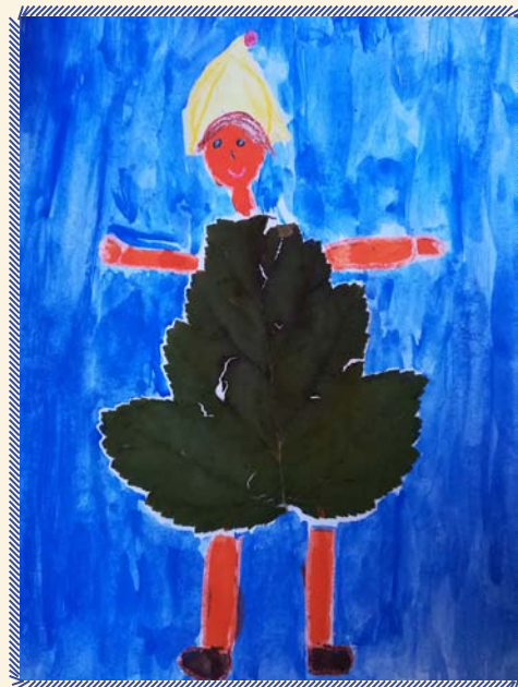
Victorie Turecki, 2. třída