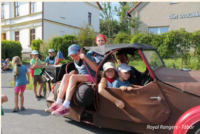
Royal Rangers - Tábor