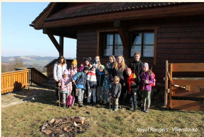
Royal Rangers - Víkendovka