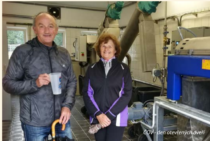
ČOV - den otevřených dveří