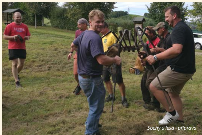
Sochy u lesa - příprava