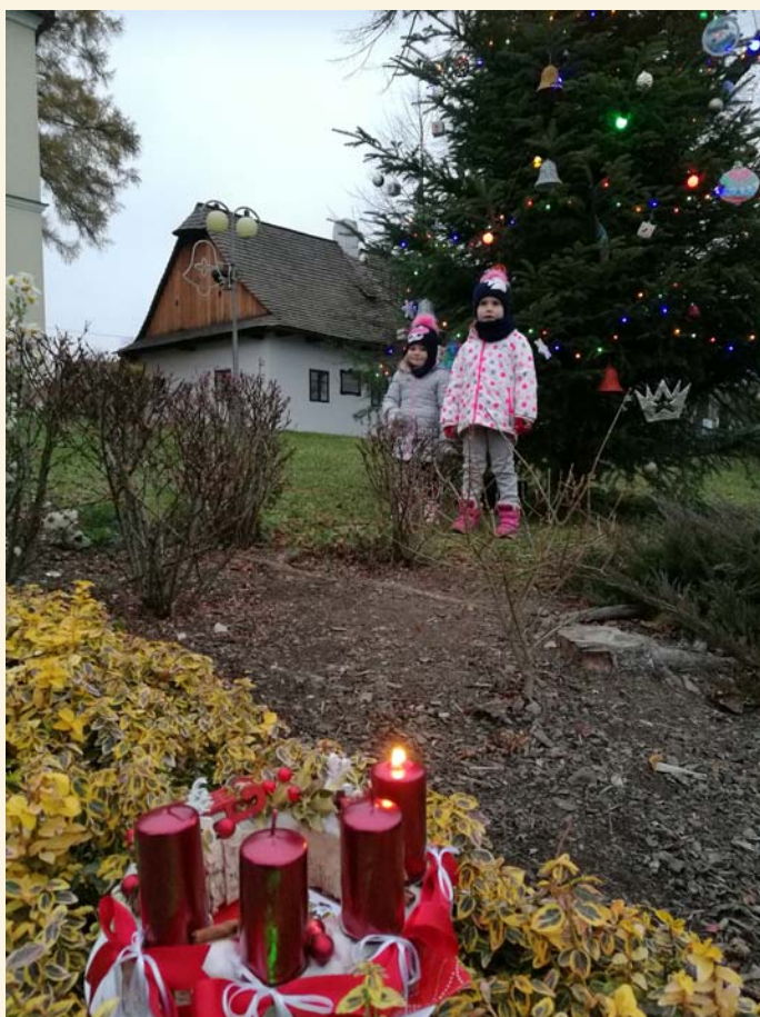
Rozsvícení vánočního stromečku v Hodslavicích 27.11.2020