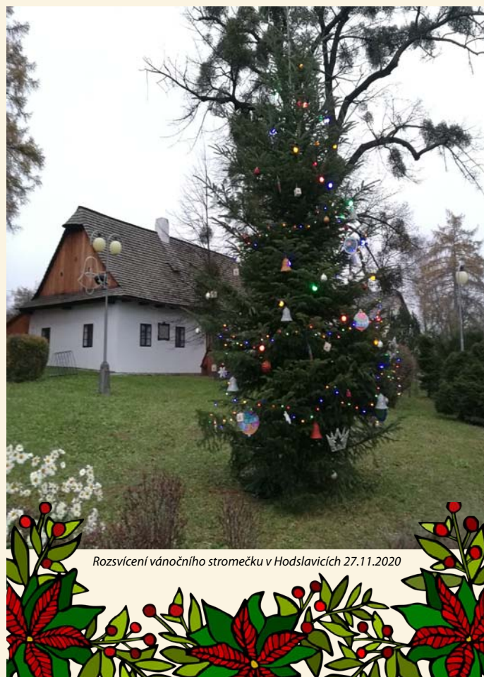
Rozsvícení vánočního stromečku v Hodslavicích 27.11.2020