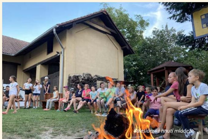
Salesiánské hnutí mládeže