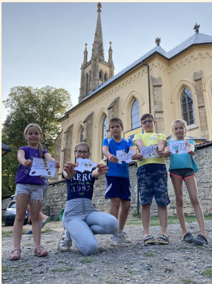
Salesiánské hnutí mládeže