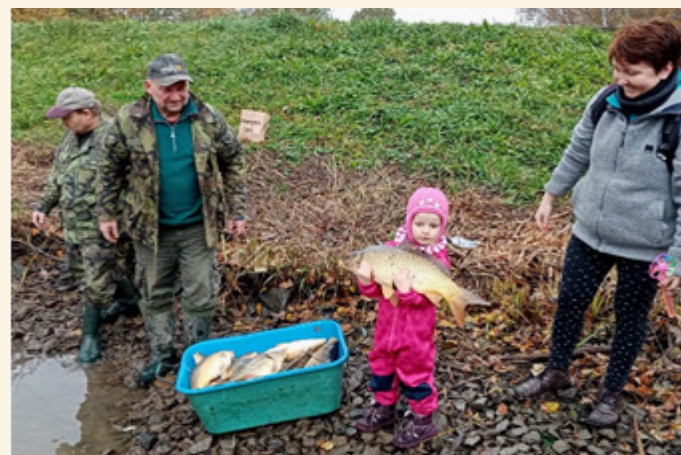
Kacabaja hlásí doplnění ryb