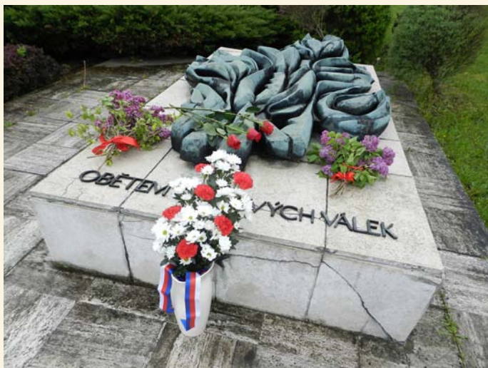
Uctění 75. výročí ukončení II. světové války