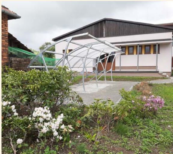
ZŠ - stání pro kola