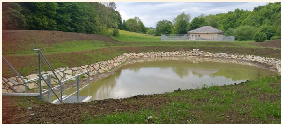
Nová čistička odpadních vod