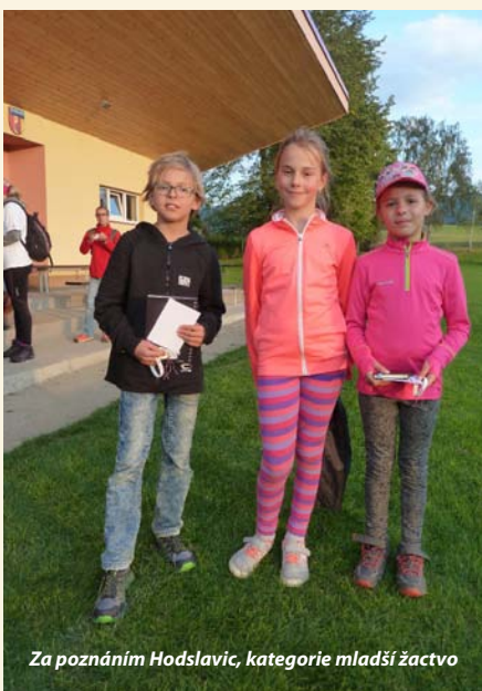
Za poznáním Hodslavic, kategorie mladší žactvo