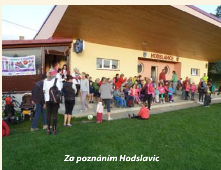
Za poznáním Hodslavic