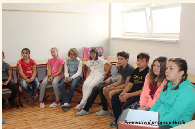
Preventivní program Hasík