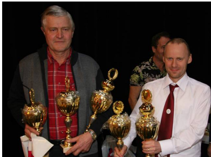
Středoevropská výstava v Holicích