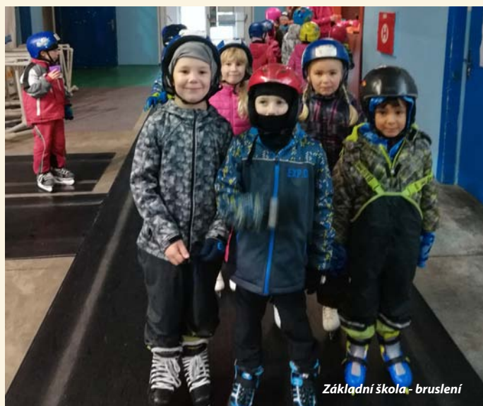
Základní škola - bruslení