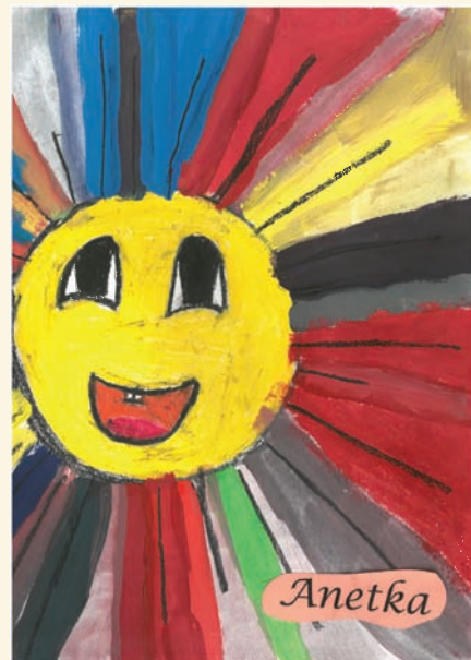
Aneta Pustówková, 4. tř. ZŠ Hodslavice