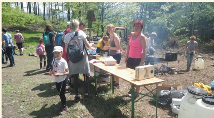
sedlo pod Krátkou

Děkujeme za účast a už nyní bych chtěl pozvat všechny, kteří si oblíbili náš tradiční pochod, na 49. ročník turistického pochodu Palackého stezka, který bude naší generálkou na následující 50. ročník pochodu v roce 2021.