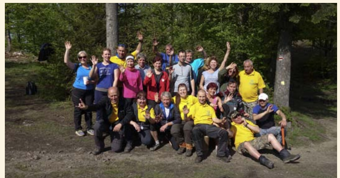
tým Palackého stezka

Klub českých turistů, odbor Hodslavice uspořádal v sobotu dne 18. 5. 2019 již 48. ročník turistického pochodu Palackého stezka, který patří mezi nejstarší v Moravskoslezském kraji. Již tradičně jsme s obavami sledovali vývoj počasí, který ještě pár dnů před pochodem nevěstil nic dobrého. Jen několik apli-