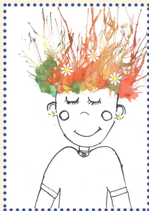
Nikola Dostálová, 4. třída ZŠ Hodslavice