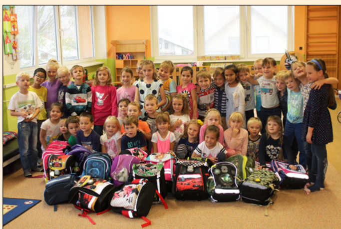
Prvňáčci ve školce