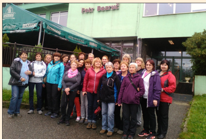
Sokol - wellness víkend