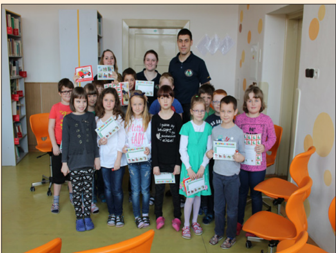
ZŠ Hodslavice - Hasík