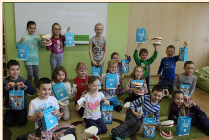
ZŠ Hodslavice - veselé zoubky