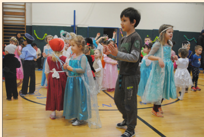
Maškarní ples v mateřské škole