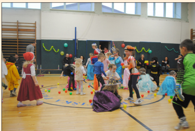
Maškarní ples v mateřské škole