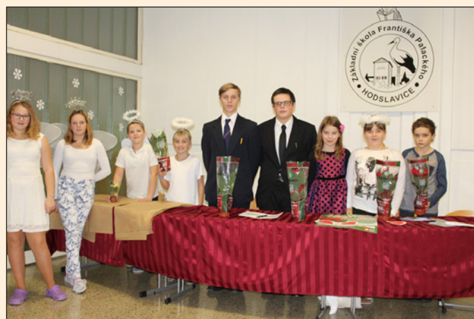
ZŠ Hodslavice - vánoční hvězda