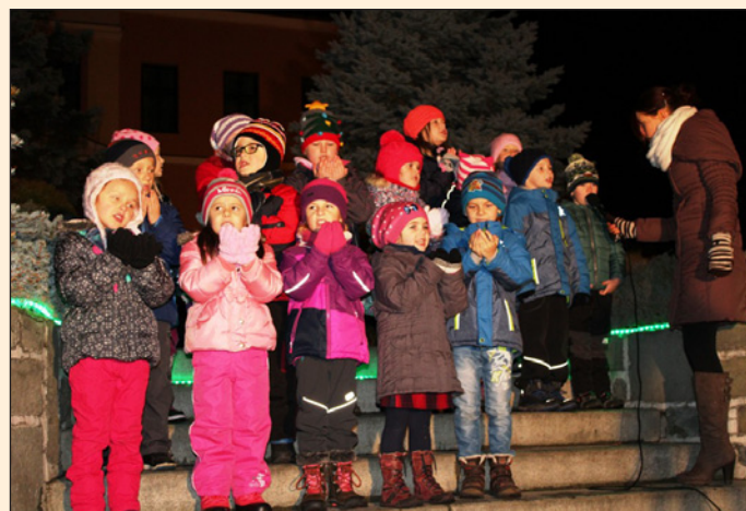
Rozsvícení vánočního stromu