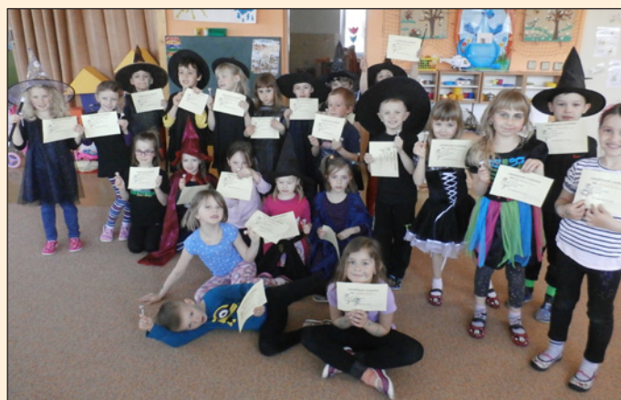
MŠ - Čarodějný rej, do tance se dej