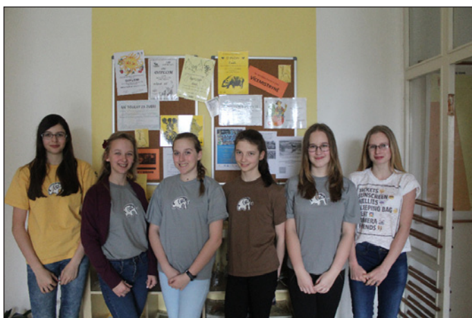
„... ta trička jsou možná lepší než...“