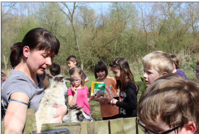
Máme rádi zvířata