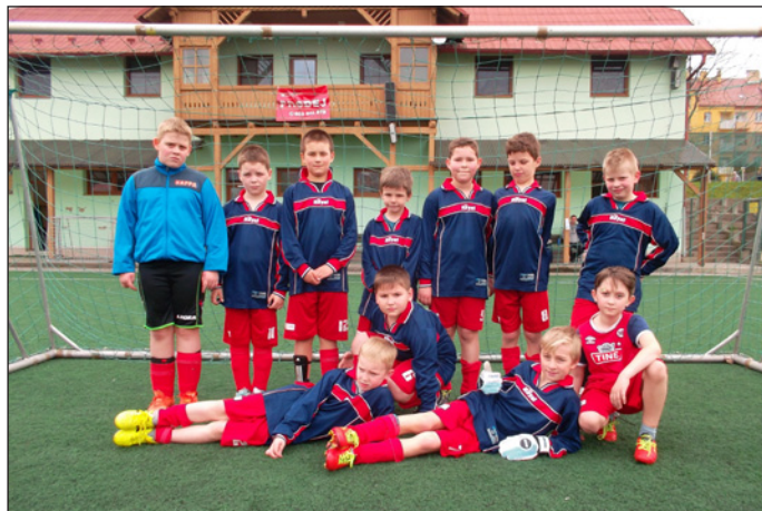
Mc Donald's Cup