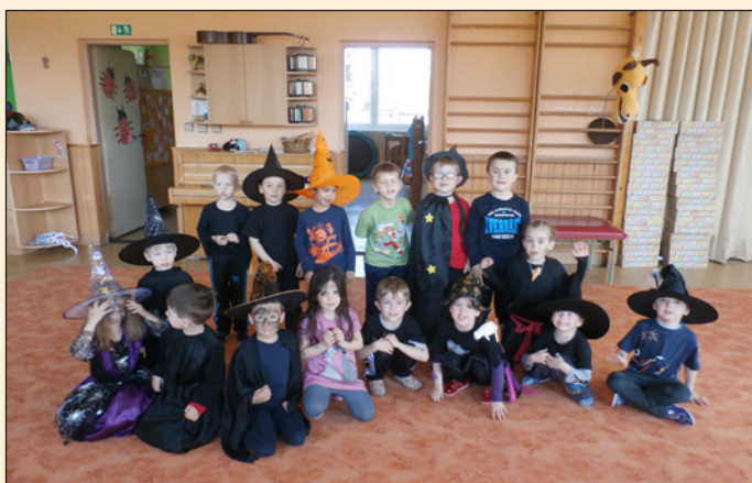
MŠ - Čarodějný rej, do tance se dej