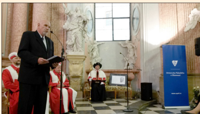
JUDr. Pavel Rychetský při proslovu