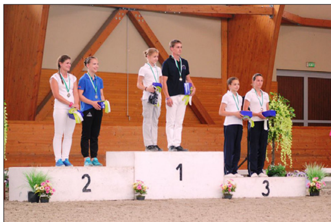
Vítězství v Pezinku