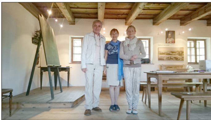
Manželé Macháčkovi-Riegrovi a Z.K.