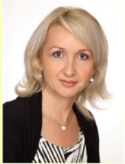
Mgr. Dana Váhalová poslankyně PČR