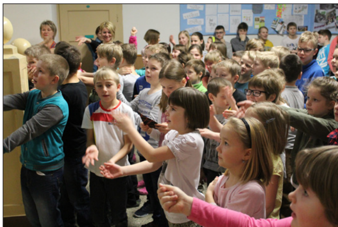
Rádio Školík - Makarena

člověk dal do řeči. Ve Valašském Meziříčí jsme přestoupili na vlak do Vsetína a tam části výpravy málem ujel vlak do Velkých Karlovic. Už jme tady!!!☺ Po sněhu ani památky a před námi dvoukilometrová cesta.