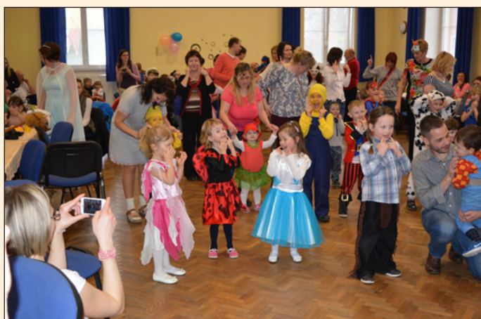
MŠ Hodslavice - maškarní ples