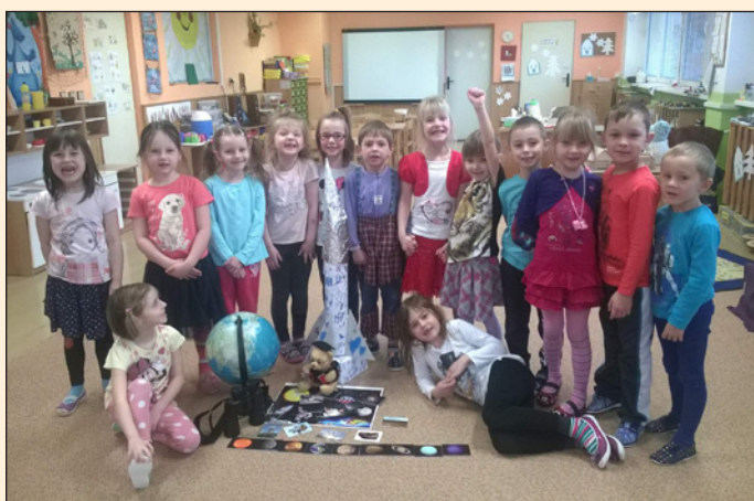
MŠ Hodslavice - Kuřátka