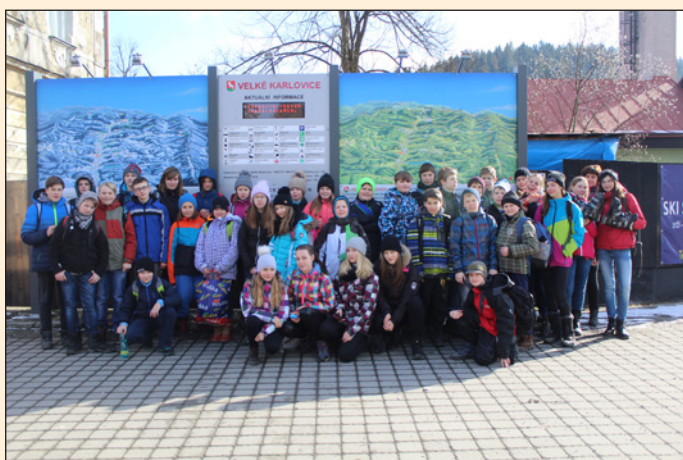
ZŠ Hodslavice - lyžařský kurz