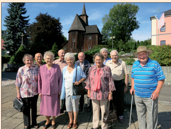
Návštěva absolventů ZŠ z roku 1947 na obecním úřadě