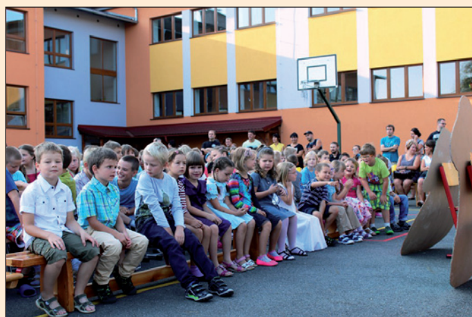
ZŠ Hodslavice - zahájení školního roku