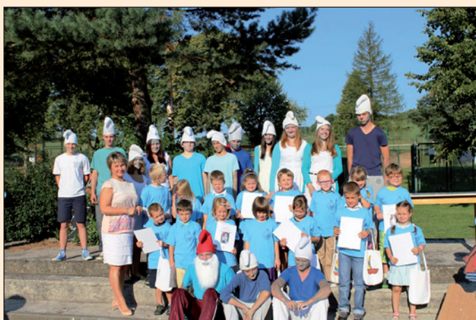
ZŠ Hodslavice - zahájení školního roku