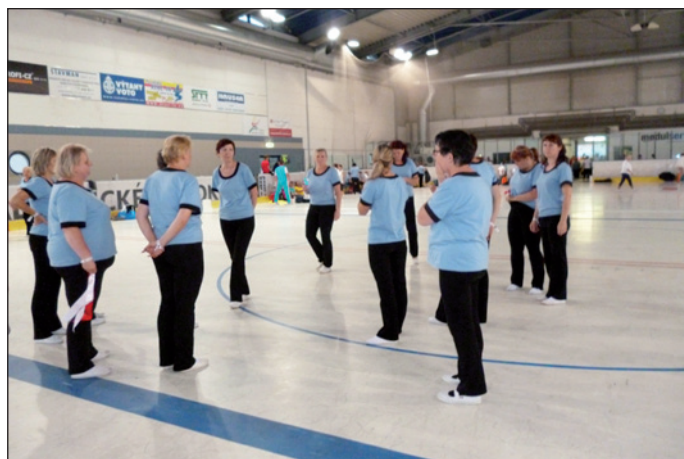
Sokolky v Plzni