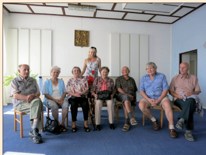
Návštěva absolventů ZŠ z roku 1947 na obecním úřadě