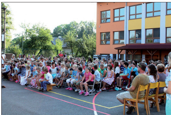
ZŠ Hodslavice - zahájení školního roku