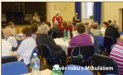
Závěr roku s Mikulášem