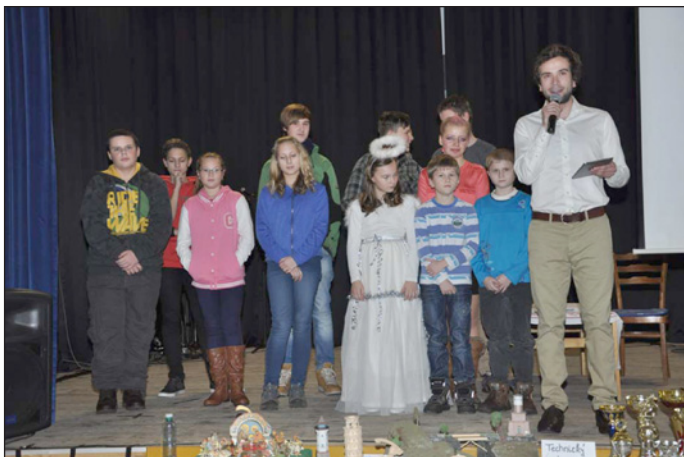
Herci dramatického kroužku SHM Hodslavice