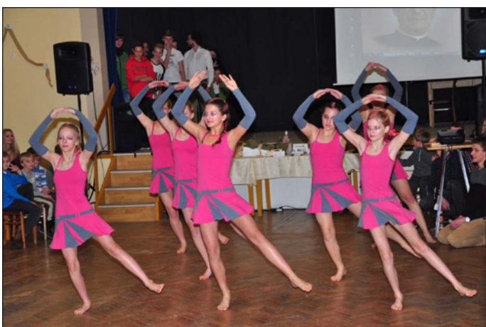
Tanečního kroužek Let's go Dance SHM Hodslavice