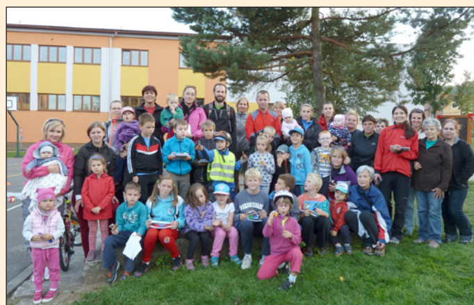
Orientační běh za poznáním Hodslavic