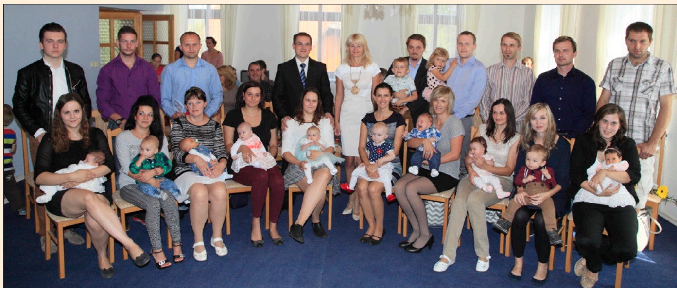
Vitání občánků, 19. září 2015