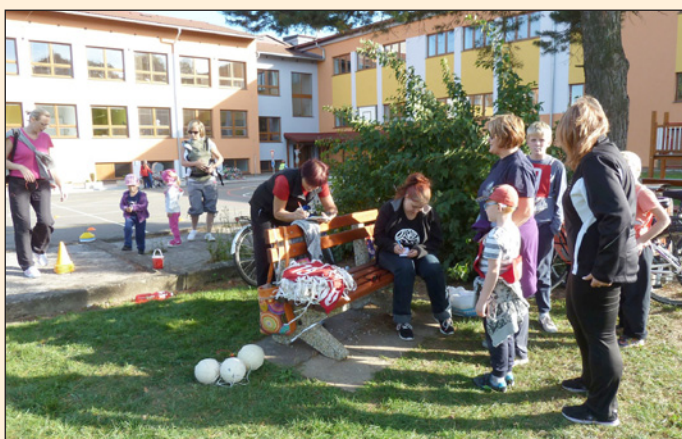
Orientační běh za poznáním Hodslavic