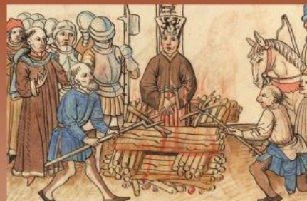
Upálení Mistra Jana Husa, Ulub Richental, Kronika Nostického koncilu, počátek 15. století