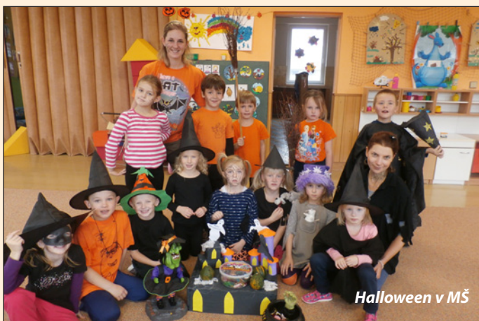
Halloween v MŠ