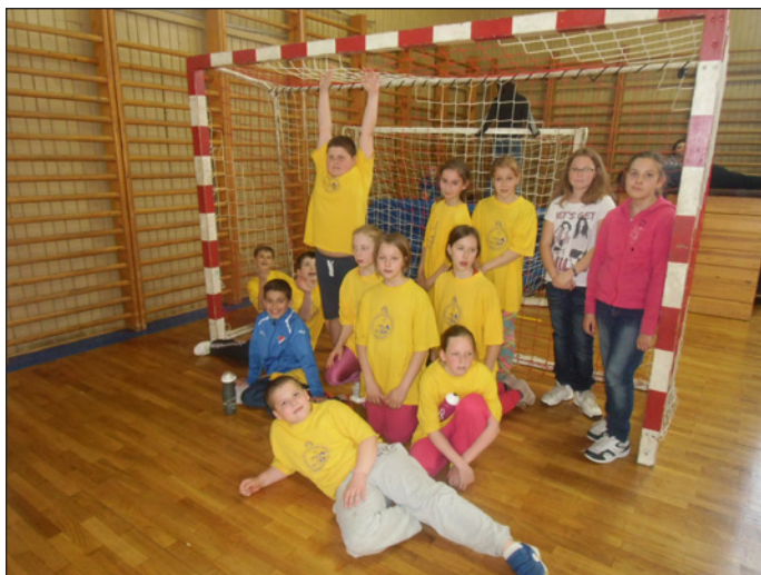
okresní finále vybíjené

Za každou pohádkou - příběhem- následovalo Poučení spravedlivého Přemysla, který několika slovy shrnul hlavní myšlenku.