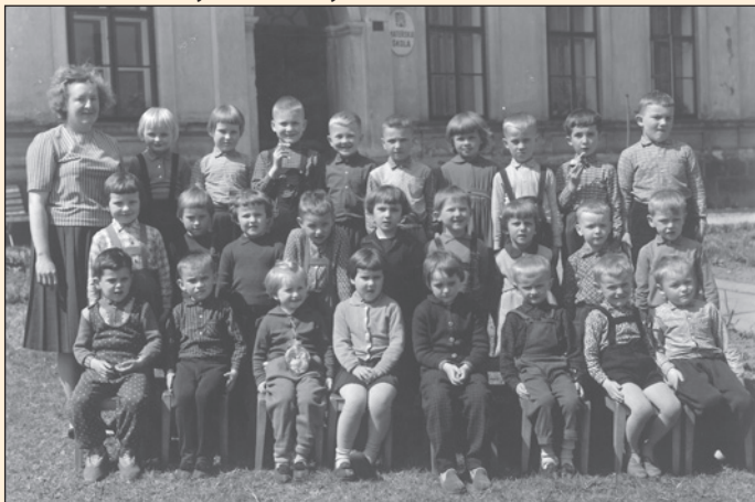
ZŠ a MŠ v roce 1964