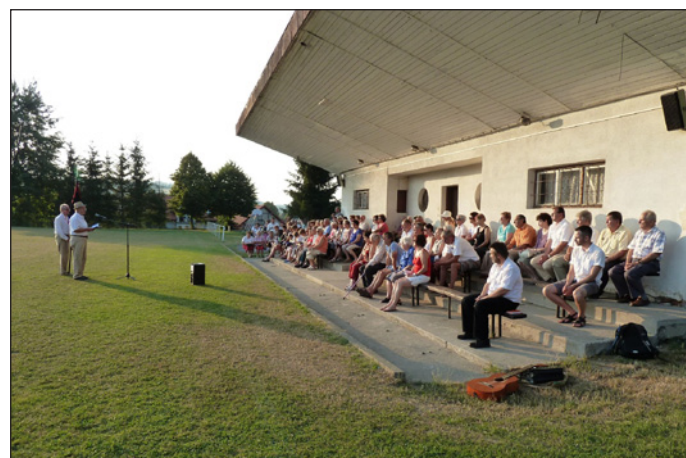
Husovské slavnosti, 6.7.2015