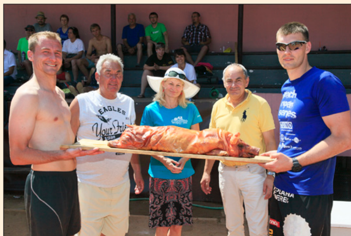
Volejbalový turnaj, 4.-5.7.2015