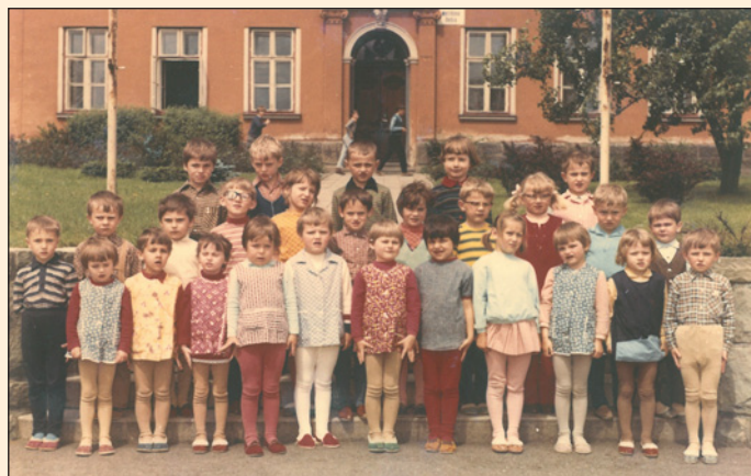
MŠ květen 1972