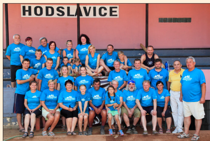
Volejbalový turnaj, 4.-5.7.2015