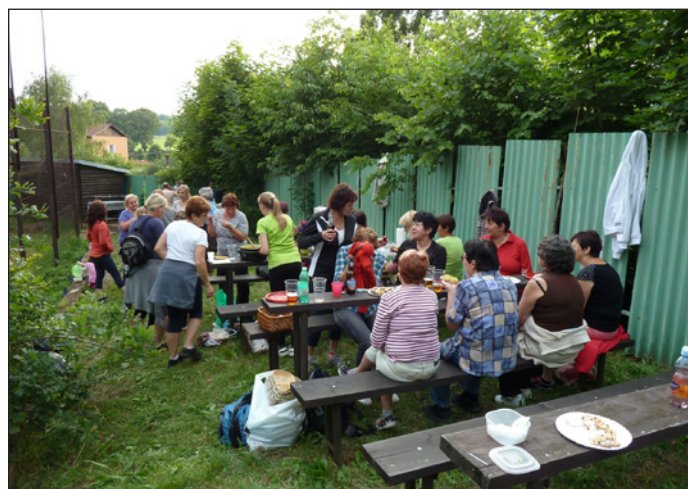
Sokol Hodslavice, škračení vajec