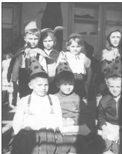
MŠ 50-tá léta

na Kramolišová. V šedesátých a sedmdesátých letech je do MŠ zapsáno vždy okolo 60 dětí, avšak v roce 1978 bylo otevřeno třetí oddělení a zapsáno 89 dětí, v roce 1979 dokonce 93 dětí a v roce 1980 neuvěřitelných 96 dětí.