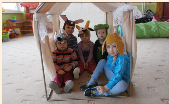
Děti v mateřské škole