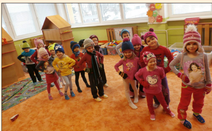
Děti v mateřské škole