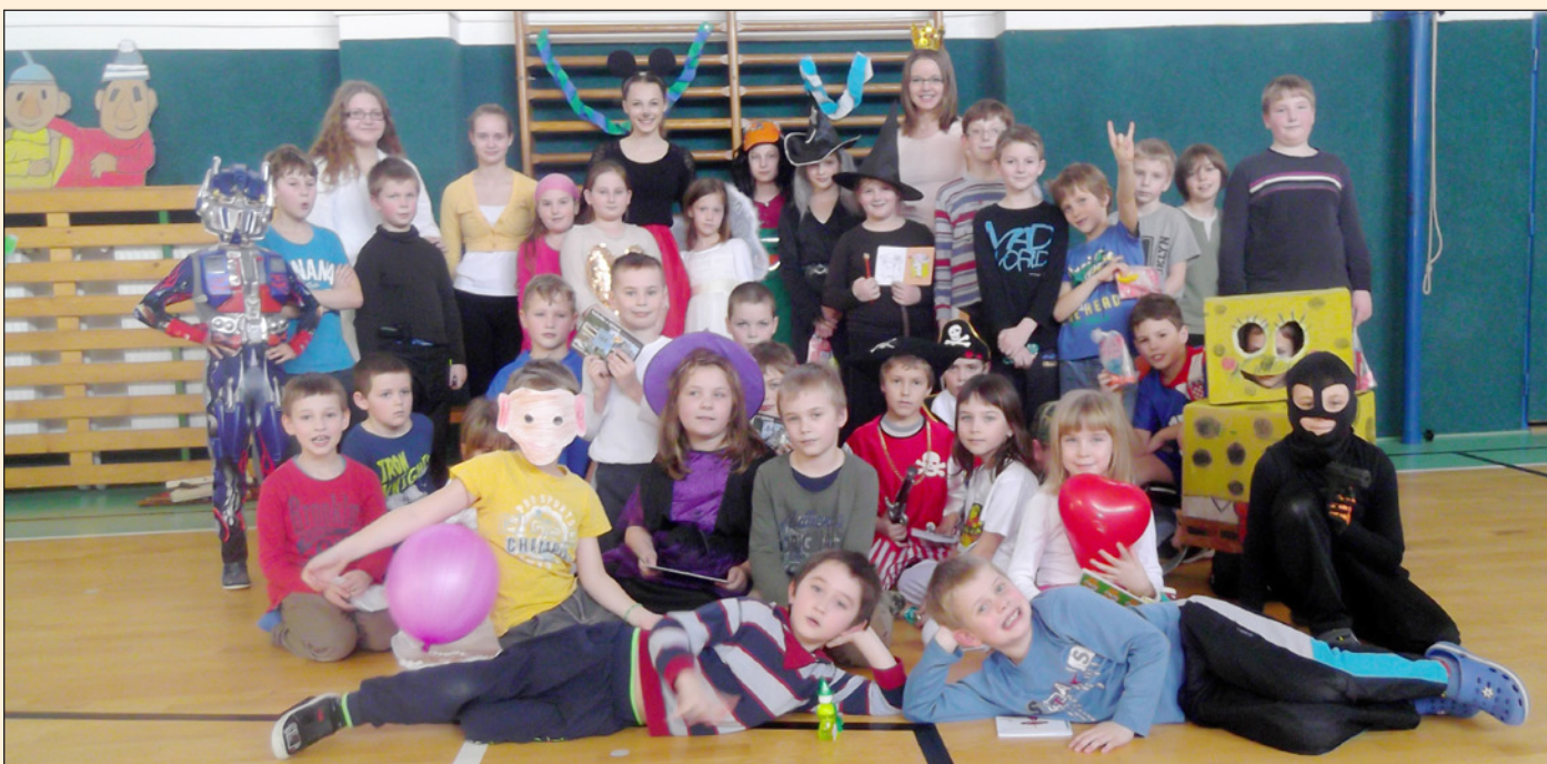
Maškarní ples ve školní družině