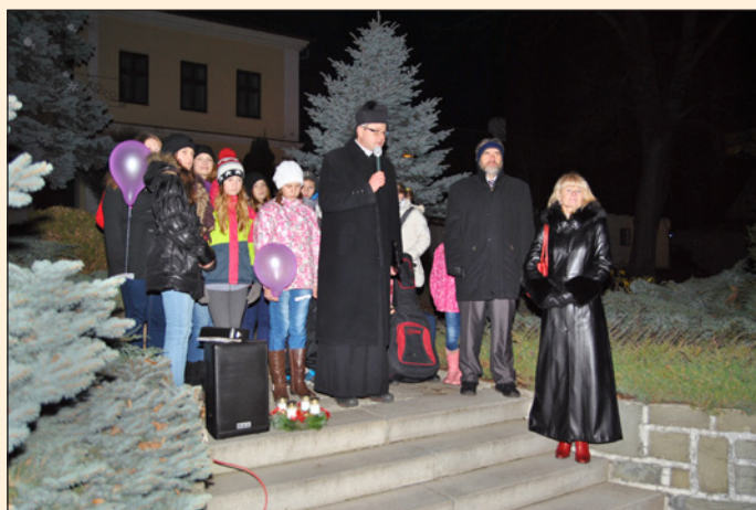
Slavnostní rozsvícení vánočního stromu ...