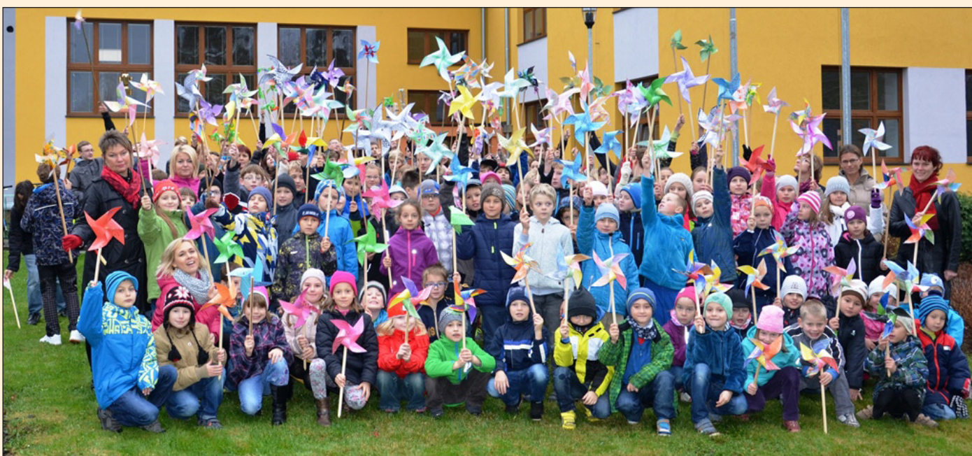
Větrníkový den v ZŠ Hodslavice