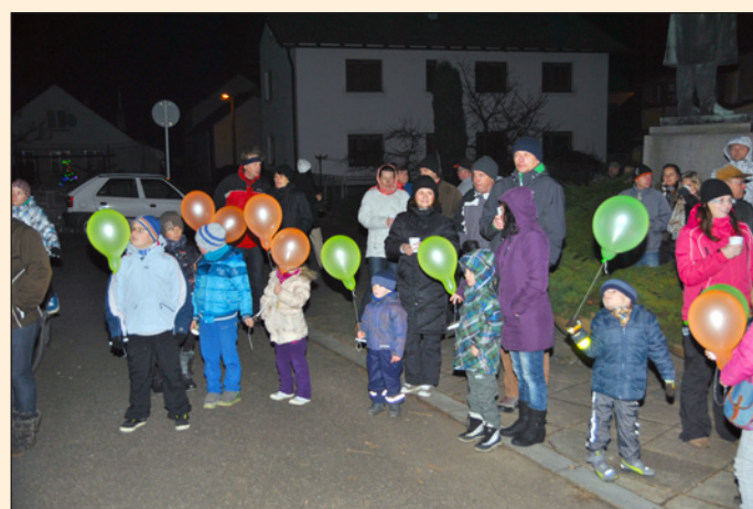
... a posílání přání Ježíškovi balónkovou poštou.