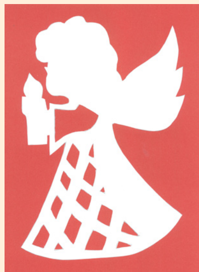
žáci 6. třídy ZŠ Hodslavice