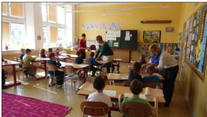
Projekt „Škola volá“

Měsíc utekl jako voda a druhá lekce projektu „Škola volá“ je za námi. Ve čtvrtek 27. března bylo setkání zaměřeno na rozvoj vyjadřovacích schopností, procvičení rytmu, zrakového vnímání a uvolňování ruky. Tentokrát nás provázel pesek Ron, s kterým jsme vyhledávali písmeno P, vytleskávali slabiky, určovali náslovnou hlásku a fixovali špetkovitý úchop tužky. U všech činností jsme dbali na správné držení tužky a zdravé sezení ve školní lavici. Všem dětem se podařilo správně vyplnit