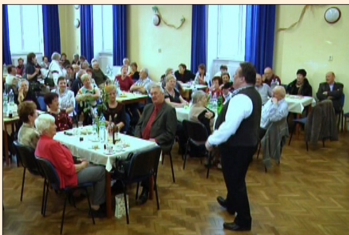
Oslava 10. výročí Klubu důchodců