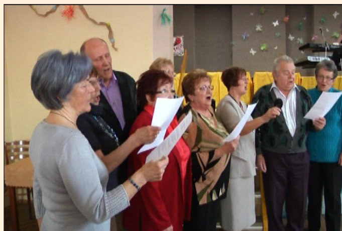
Oslava 10. výročí Klubu důchodců