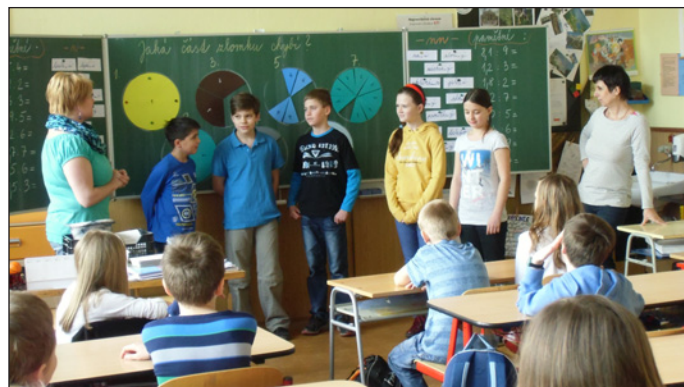
Návštěva žáků z Krhové

Dne 18. března navštívili naši základní školu žáci ze 4. a 5. třídy z nedaleké Krhové. Po seznámení se spolužáky a rozdělení do skupin bylo pro děti připraveno několik soutěží, ve kterých si poměřily síly nejen fyzické, ale i vědomostní. Jednotlivé soutěže plnily v různých učebnách, a tím měli možnost prohlédnout si všechny prostory školy. Na dětech bylo vidět, že se snaží zadané úkoly plnit velmi zodpovědně, a proto si všechny děti odnesly nejen sladkou odměnu, ale i dobrý pocit z příjemně stráveného dopoledne. ☺