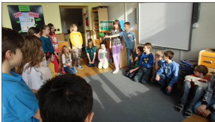
Návštěva žáků z Krhové