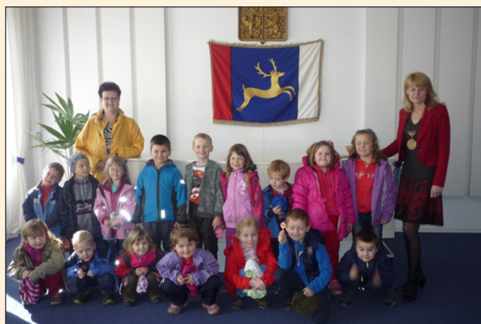
Návštěva dětí z MŠ na obecním úřadě