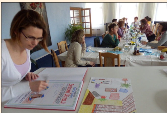
Setkání s učiteli u příležitosti Dne učitelů