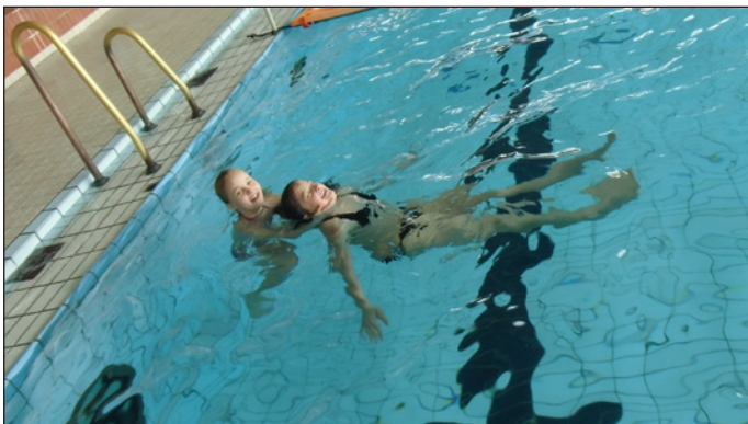
Branně - záchranný kurz

Samozřejmě nic nebude bránit tomu, aby asfaltové hřiště za školou využívali žáci i veřejnost i mimo dobu školního vyučování. Vstup je možný brankou (je umístěna u brány blíže antukovému hřišti), která bude celodenně otevřena. Návštěvníky jen žádáme, aby dodržovali provozní řád a hřiště využívali pouze k účelu jemu určenému.