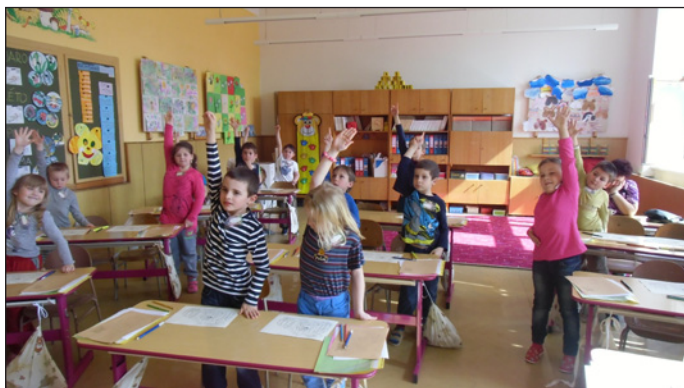
Projekt „Škola volá“

V úterý 25. března opět vysílalo Rádio Školík, tentokrát ze 4. třídy.